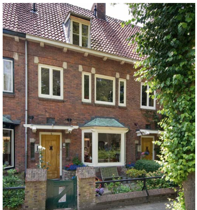
Rijtjeshuizen aan de Lorentzkafe in Leiden (1934-1935).